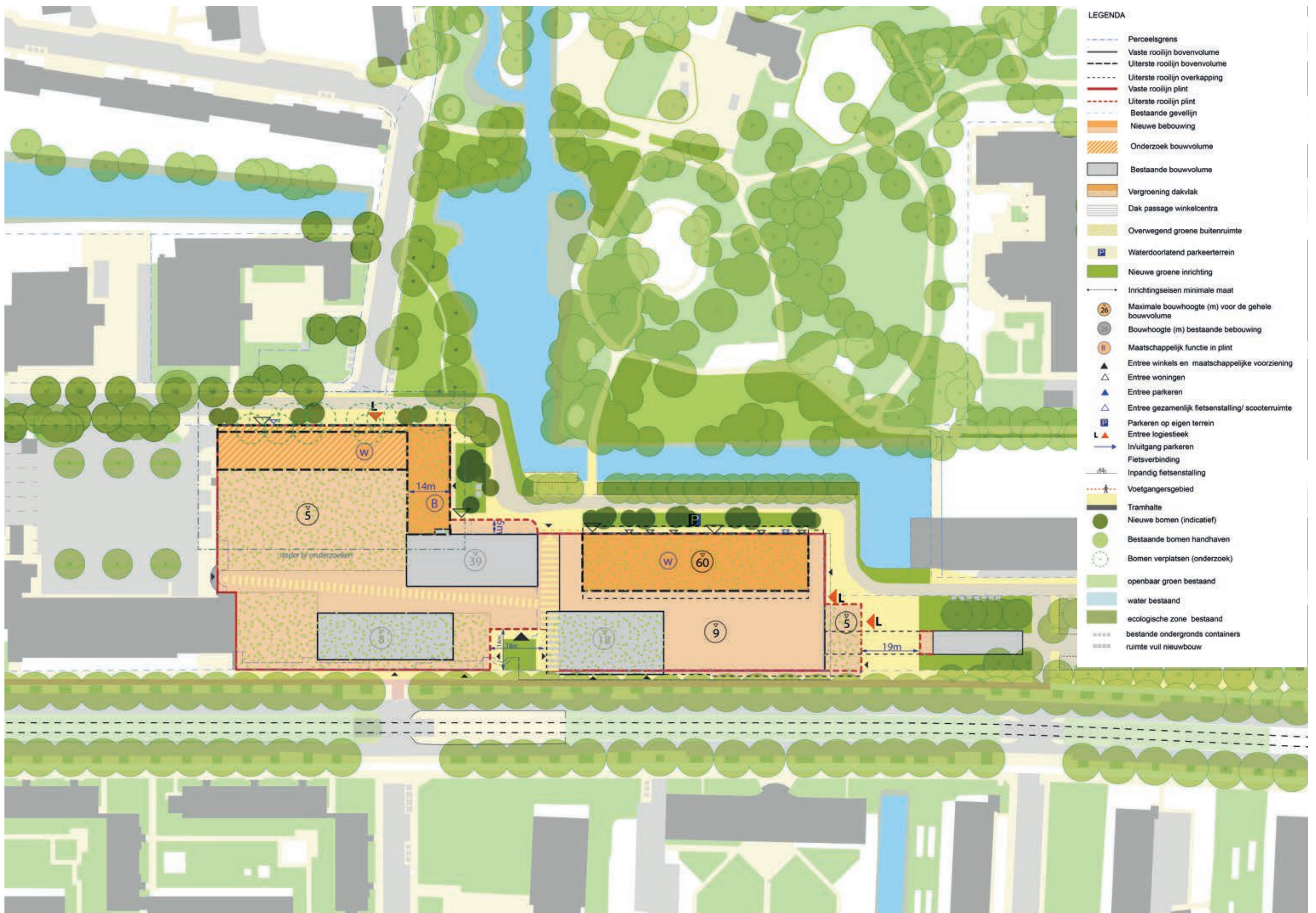
Visie voor de herontwikkeling